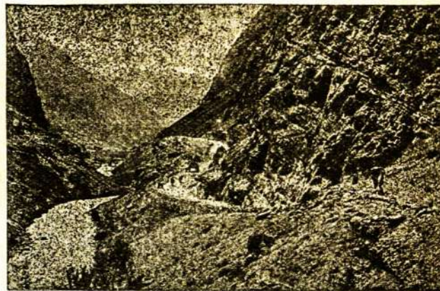
Kelias Kaukazo kalnuose ir upė.

su senobiniu kryžium, pastatytu būk karalienės Tamaros atminčiai. Anot legendų nuo to kalno Tamara sviesdavus žemyn savo numylėtinius, kaip tie jai nusibosdavę.