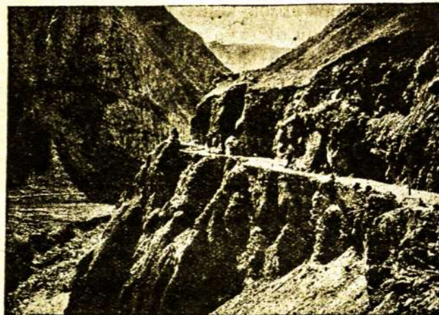
„Velnio Vartai“ Tereko augštumoje.

nedirsteli, vis nauji ir vis gražesni reginiai. Kartais pati širdis lyg apstoja tvaksėjus po didžiųjų išpūdžių įtekme. Uolų šonais vienur sriuvena versmelės, kitomis šoplynėmis nuo kalnų viršūnių kaip gieslos leidžiasi vandenpuoliai. Augštesnėse versmėse viršuje vanduo sušalę, tik pa-