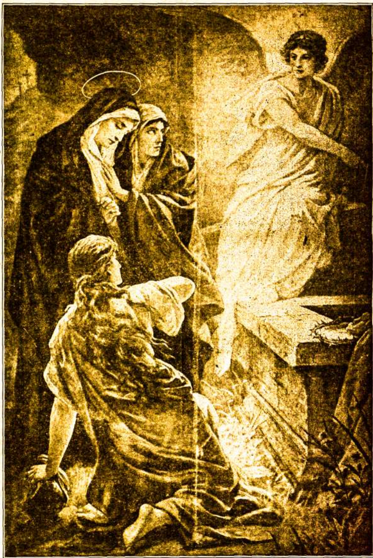
Prisikėlė. nėra jo čia: še, vieta, kame buvo paguldytas. Alleliuja!