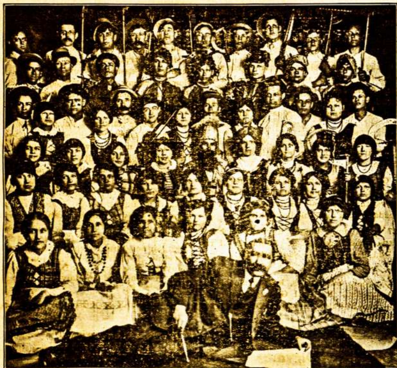
Palangos Senišno Talkininkai.

Pertraukose sudainuos jaunų mergaičių choras tautiškas daineles Svetainėje 49 Congress ave. Inžanga 15c. kiekvienam.