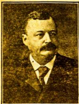
Pennsylvanijos atstovas Sv. Valstijų Senate Boies Penrose.

Vienas tėra svarbiausias išėjimas 1914 m. kampanijoje — tai pakėlimas nupuolusios Pennsylvanijoje pramonės, atidarymas dirbtuvių, varymas darbo pilnu laiku, geros algos kiekvienam darbininkui, kaip čiagimiai, taip ir iš kitur attelavusiam by tik jis nori darbo, atgavinimas nupuolusio ir užslopinto biznio, kuris dabar žemiau stovi negu prieš dvidešimt metų, kada buvo paskutinis prieš Wilsoną Demokratų prezidentas, ir sugrazinimas fermeriui pelningo marketo, kurį jis turėjo pirmiau, kada Pennsylvanijos pramonė gerai ėjo, nes buvo apsaugota Republikonų maito, ir darbininkai turėjo pinigų nusipirkimui farmų produktų.