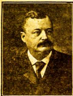
Pennsylvanijos atstovas Sen. Valstijų Senato Boisie Penrose.

Ar tu žinai, kad Pennsylvanijos valstija, išėmus iš dalies Wisconsin, yra vienintelė Amerikoje valstija neturinti skolų?