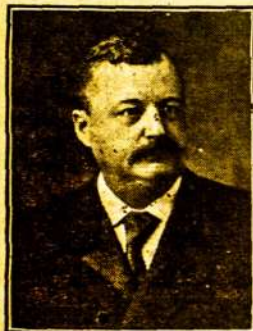
Pennsylvanijos atstovas Sen. Valstijų Senate Boies Penrose.

Pn. Redfield, Komercijos sekretorius Wilsono kabinete, yra asmuo, kuris pučia muilo burbulus apie Wilsono