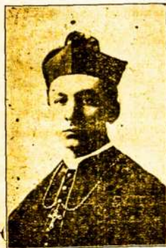
J. M. vyskupas J. Mundelein