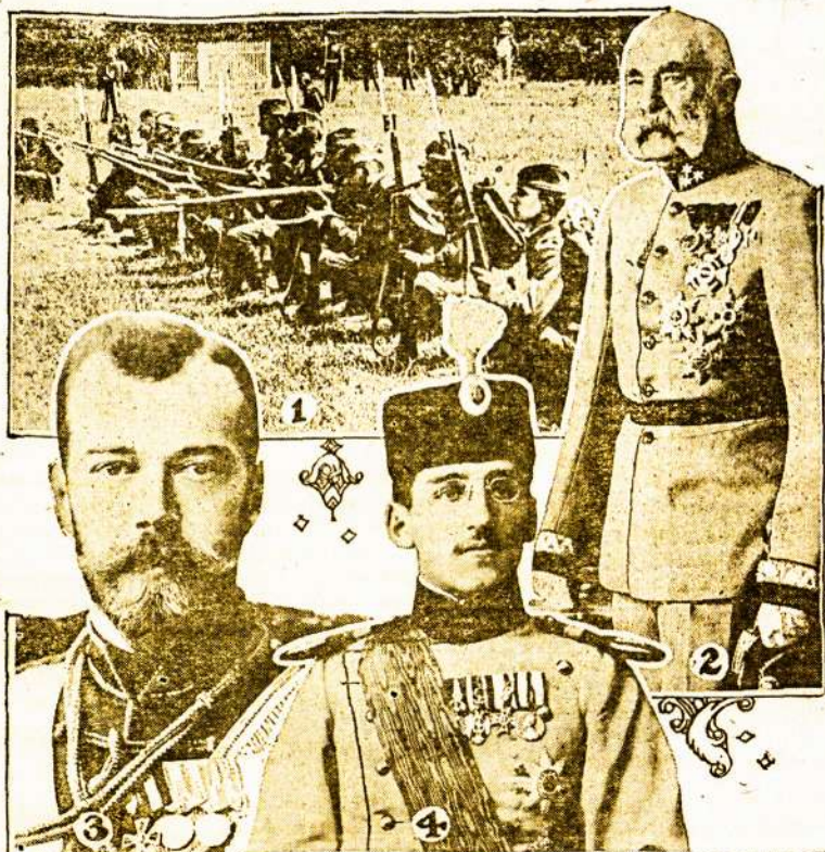
1 SERVIAN INFANTRY 2- EMPEROR FRANCIS JOSEPH 3- CZAR OF RUSSIA 4- CROWN PRINCE ALEXANDER OF SERBIA.

1) Serbijos šiaulių būrys. 2) Austrijos imperatorius Pranciškus Juozapas. 3) Rusijos caras Nikolajus. 4) Serbijos sosto įpėdinis, princas Aleksandras.