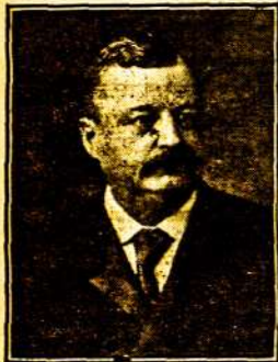
Pensilvanijos asistovas Sv. Valetijų Senate Boiaie Penrose.

A. Mitchell Palmer gali sau barstyti dulkes, bet Pensilvanijos žmonėms akių neužkrės. Jis negali paslėpti to fakto, kad jis balsavo už Wilsono—Palmerio liūso mi-