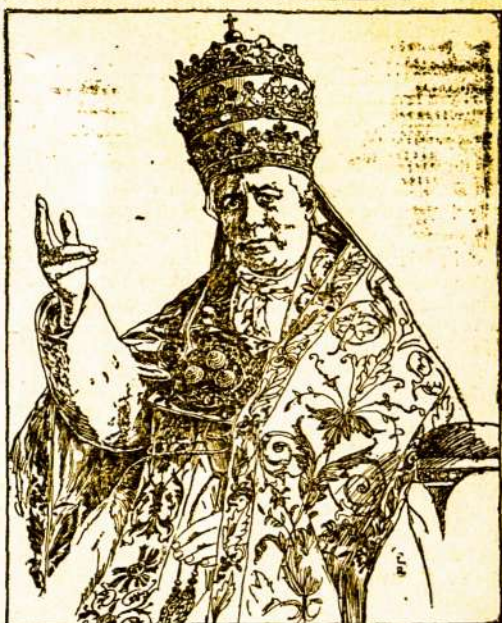
A. A. ŠVENTAS TEVAS PIUS X.

— Vokiečių ir Anglijos kolonijose Afrikoje taipogi įvyko susirėmimai, kuriuose viršų paėmė anglai.