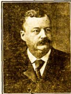
Pensylvanijos atstovas Suv. Valstijų Senate Boisie Penrose.

„Tai Pensylvanijos gerbuvio Benediktas Arnold'as“, taip Senatorius Penrose pavadino A. Mitchell Palmerį, kuris, būdamas išrinktas Kongresan iš pramonės distrik- to, kovojo prieš šios šalies pramonę, palaikydamas Un-