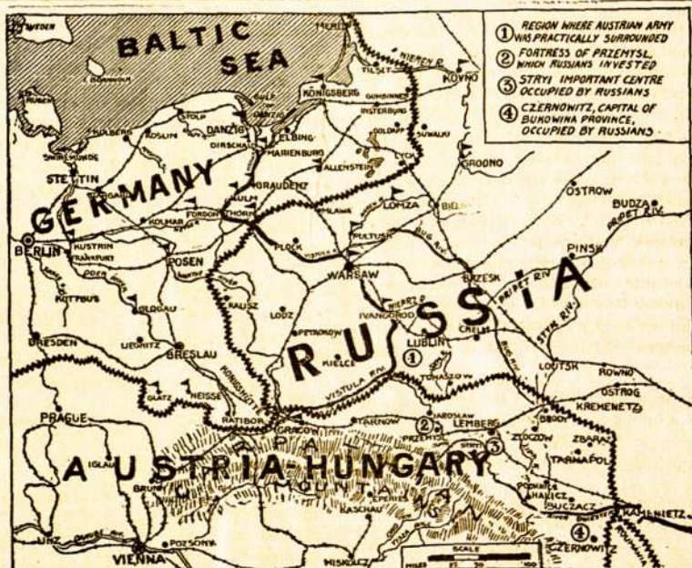
Žemlapis Vokietijos, Austrijos ir Rusijos (Lietuvos ir Lenkijos) žemių, kur pastaromis savaitėmis buvo smarkūs susirėmimai tarp tų viešpatijų armijų. Numeriais (1, 2, 3 ir 4) paženklintos vietos, kur rusai labiausiai sumušė austrijokus.

Vokiečiai sudaužė garsią istoriškąją Rheimso katedrą. Subatoje, 19 d. rugaėjo vokiečių armija su mitraliezėmis laike trijų dienų bombardavimo miesto Rheimso sudaužė vieną seniausių ir puikiausių Prancijos Katedrų Notre Dame. Taipgi kanuolių šūviai išburbino St. Remi bažnyčios langus. Rheimso vyskupas su keliais kunigais pasislėpė nuo vokiečių pašėlimo pagrindyje. Vokiečiai per tris dienas leido be jokios atodairos į žmoniškumo teises kanuolių ir šautuvų ugnį, naikinančią puikiausias prancūzų architektūros brangenybes ir daugybę žmonių pastogių. Tarp sudaužytų Rheimse triebesių, Katedra Notre Dame perstato puikiausią ankstviausių gotikų pavyzdį. Ji įsteigta 1211 m., o užbaigta galutinai 1458 m. Taigi jos darbas tęsės su per-