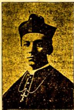
J. M. Brooklyno Vyskupas Mundelein.