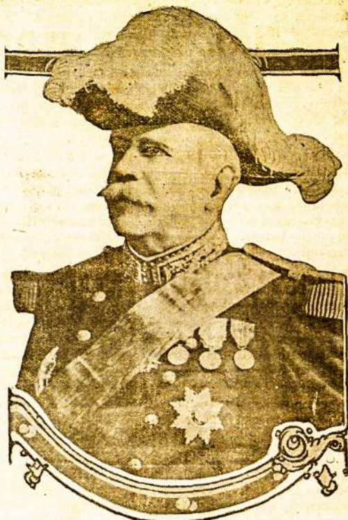
Generolas Joffre, vyriausias prancūzų kariumenės vadas.

Karalius Petras veda serbus. Londonas, 7 gruodžio. Telegramos iš Nišo skelbia, jog Serbijos karalius, kuris delei nesveikatos visą šalies valdžią laik-