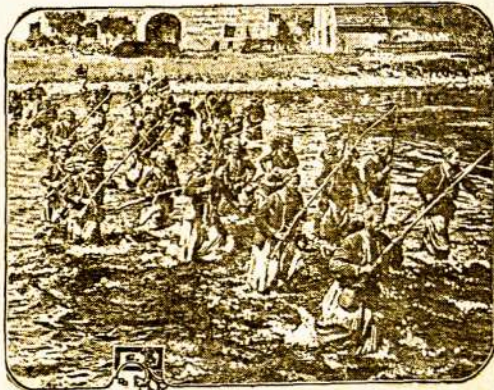
Turkų kareiviai breda per upę.

Bavariečiai panešę labai sunkius nuostolius su 9000 užmuštais iš 13.000. Viens regimentas iš 3000 kareivių neteko Flandruose 1600 vyrų, įskaitant ir kelis generolus.