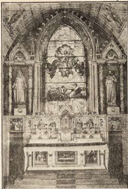
Didysis Altorius. Viešpaties Atsimainymo paveikslas lange ant stiklo. Panašūs šventaisios ir šv. Juozapo koplytėlės—stovylos, koplytelių viršuje cherubimų-paveikslai. Žemiaus paveikslai: Viešpaties Ugdinimo, 4 Evangelistai ir šv. Dvasis (aukšto lauko), po Lėkijos pusi Viešpaties Kristaus. Apačioje (patalioje) Panašūs šventaisios Naudingųjų Dėstytojos, Paskutinis Vakariėnis (Pirmųjų Milių) ir Gerėjo Plėmens paveikslai.