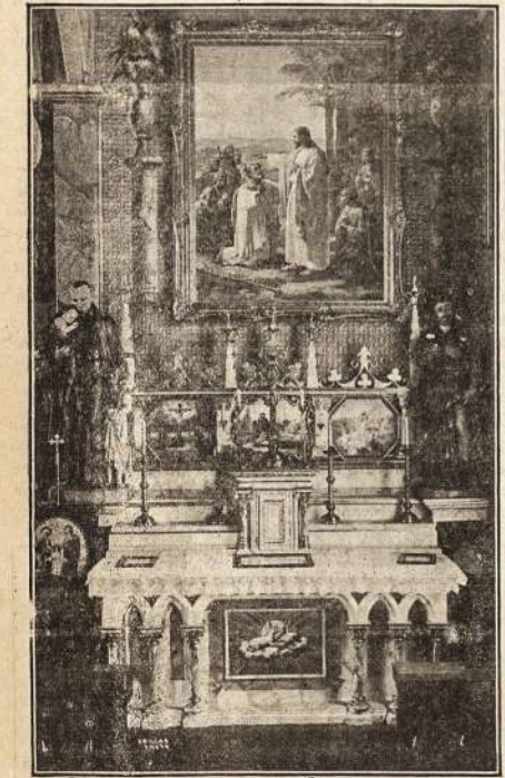
Šoninis Altorius (šv. Vincento Draugijos aukta), Didis paveikslas—šv. Petri ir tų valdijos sutartinas (šv. Petro ir Povilo Draugijos aukta). Šv. Vincento ir šv. Roko stovylos. Altoriai paveikslai: Nukryžiuojamo, Goro Samaritono ir V. Pr. šėkėlimo.