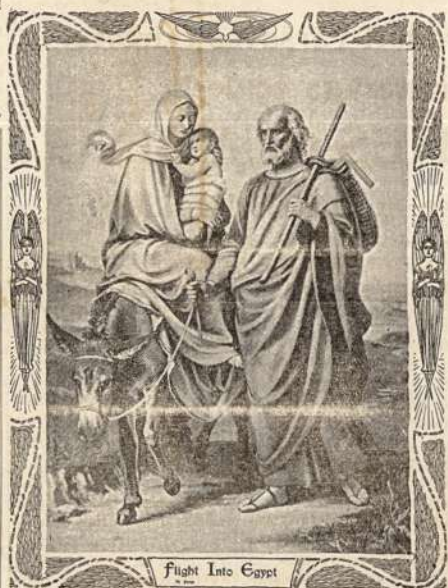
Flight Into Egypt Bėgimas į Egiptą.

— Kągi tu veikei kasimuose? — Patronus prinešiau. Kareiviams reikia vaikštinėti pasilenkusiems, o aš drąsiai vaikštinėjau, man tas darbas tinka. Soviau tik du syknes šauti apicieriai neleidžia, — prataria akis nuleidęs.