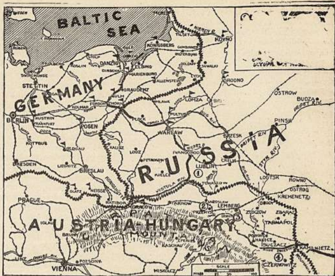
Žemlapis Rusijos, Vokietijos ir Austrijos sienų, kur ėina svarbūs mūšiai.

Dorpa te daug sustatya protokolų dėl kalbėjimo gatvėse vokiškai. Kaltinamieji baudžiami administratyviu būdu.