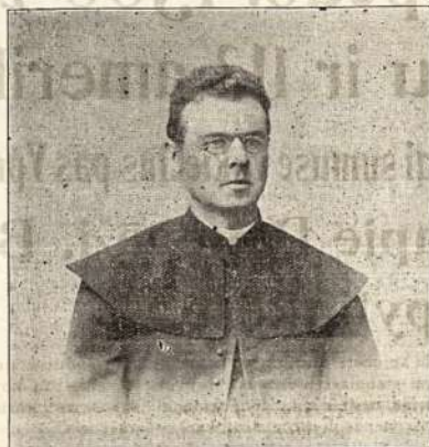
PRALOTAS S. MACULEVIČIUS (MAIRONIS).