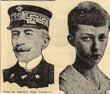
Italijos laivyno ministeris ir žymiausias šalies strategikas.

Trie vokiečių atakos La Pretre miške, prancūzų Lorraine, pas Pont-a-Mousson buvo ūmai atmuštos. Ant dešiniojo upės Fecht krašto, viršutiniame Alsace, sanjungečiai pasivare pirmyn ant viso fronto vos per vieną kilometrą (apie angl. mylios du trečdaliu). Taigi visai nedaug.