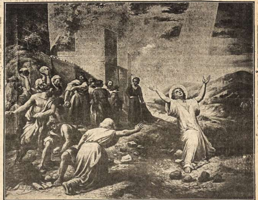
Nukankinimas šv. Stepono, pirmo kankinio.