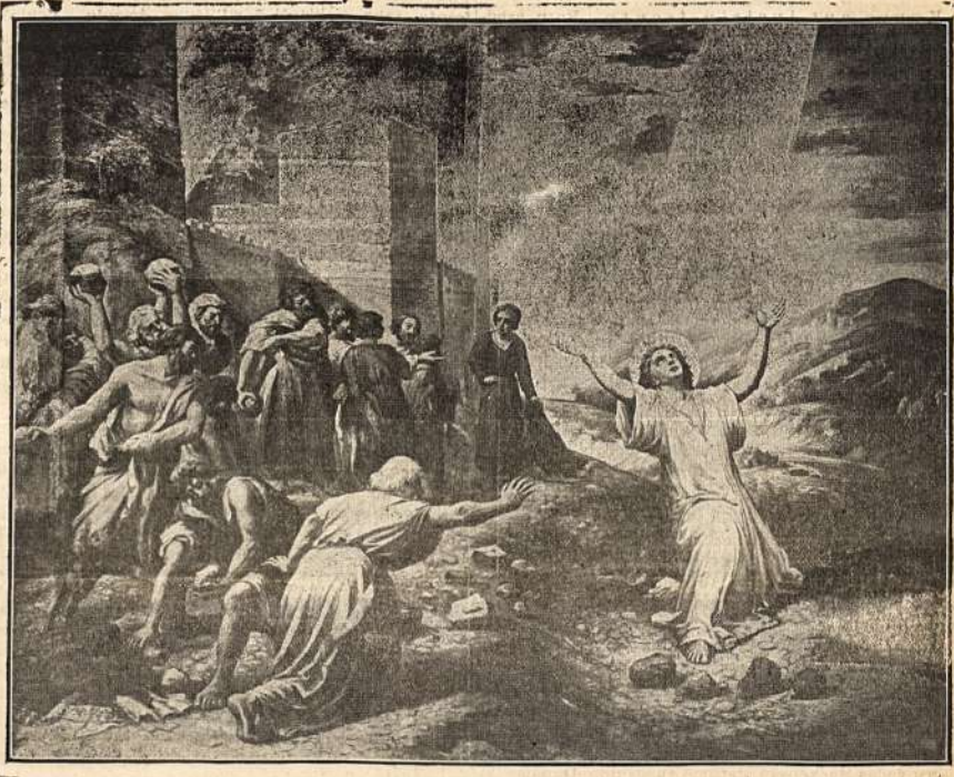
Nukankinimas šv. Stepono, pirmo kankinio.