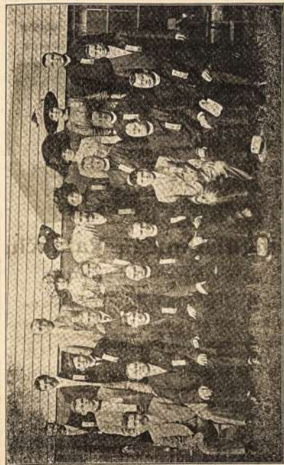
Lietuvių Biativinkų Seimas Lawrence, Mass.