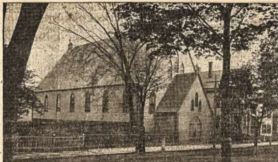
Lietuvių katalikų bažnyčia Lawrence, Mass.

Rymas, 18 rugpjūčio. Italija rengiasi išeiti karėn su Turkija.