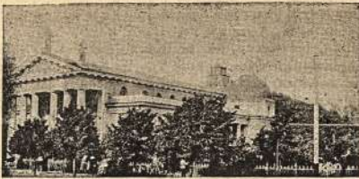
Vilniaus katalikų katedra

Turint Vilnių ir Dvinską vokiečiams lengva būtų stumtis geležkelio ant Petrogrado. Paėmus Rygą vokiečiai beabejonės stengsis pasiekti ir Revelį, atstui 170 mylių, miškų keliais šiaurėje. Apėmę visus tris miestus—Vilnių, Dvinską ir Revelį vokiečiai turėtų du geležkelio vedančių Petrogradan.