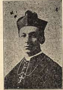
J. M. Vyskupas Mundelein.