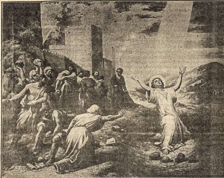
Nukankinimas šv. Stepono, pirmo kankinio.