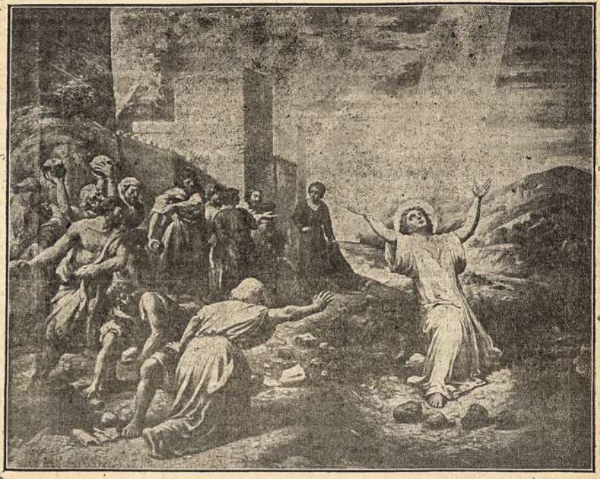
Nukankinimas šv. Stepono, pirmo kankinio.