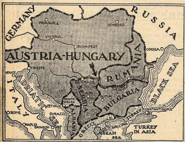
Zemlapis Serbijos, kurios kalnyuose bus smarkiausi susirėmimai tarpe Teutonų ir Talkininkū.

P-lei M-čiutei iš Worcester'o, Mass. Ačiū gražiai ūz išreikšimā pasigėrėjimo mūsū savaitraščiū „Zvaigzde”, kuri paduoda, anot Tametos, dauglāsia žiniū iš nelaimingos šiais laikais mūsū tēvynēs ir iš karēs. Tečiau Jusū rašteliū negalime sunaudoti savo laikraštyje: — Perilgas, o ir klausimai jame paleisti ne nauji. Rašykite kas jūšū mieste ger girdēt, kaip darbuojasi ten lietuviū draugijōs, koki darbai ar bedarbēs,—tokios rūšies žinioms „Zvaigzdes” skiltyse visuomet bus vietos.