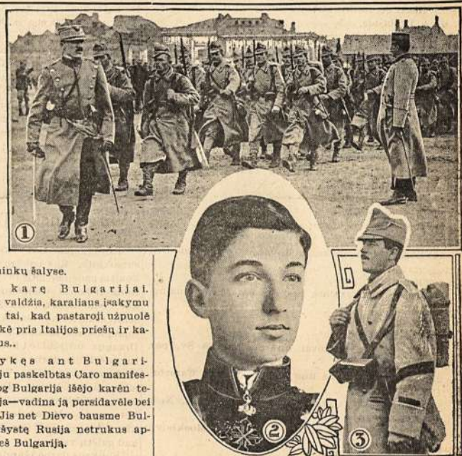
1) Rumanijos kareiviai mobilizuojami. 2) Bulgarijos sosto ipedinis. 3) Rumanijos pėstininkas.

— Amsterdamas. Pastaroju Serbijos sosto ipedinis