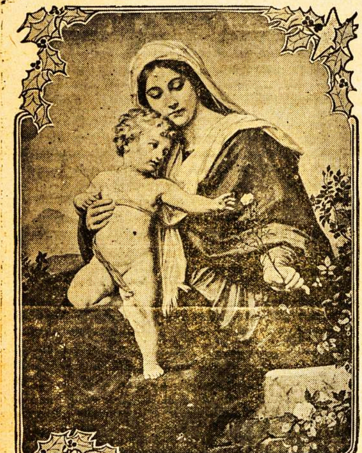
MARY AND THE INFANT JESUS.

Žmonių apsigynimo spēka tapo suformuota, jis sakė, idant apsaugoti tautiškąjį susirinkimą, ir tat netrukus bus užbaigta. Valdžia yra pasiryžus kovoti prieš visokias pastangas kliudyti tautos susirinkimui kuris, bus sušauktas už keturių savaičių ar ankščiau.