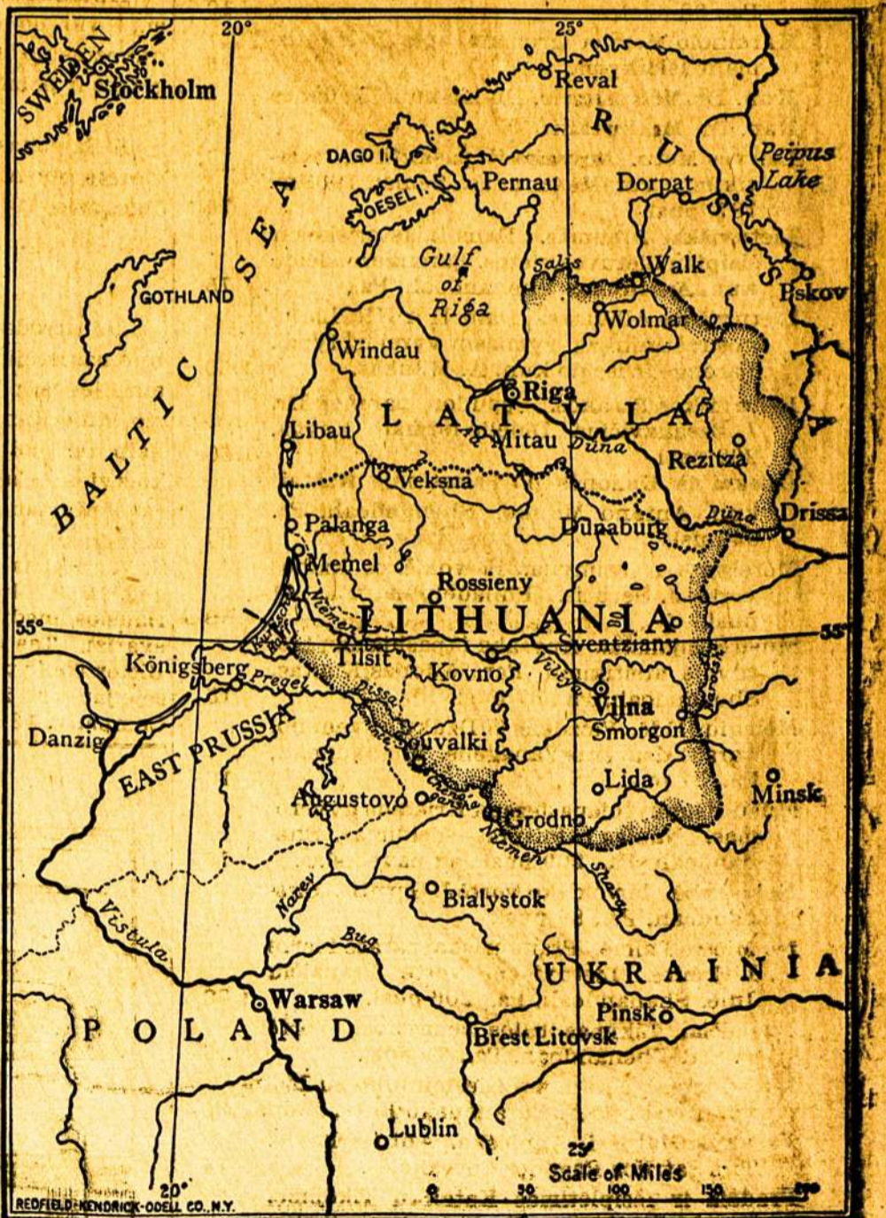
Zemlapis iš kun. A. Jusaičio knygos.

Butų geistina, kad patriotiški musų tautiečiai padė- tu praplatinti tą knygą ypač Amerikoje tarp Valstijų valdininkų (state officials) ir miestų knygynų.