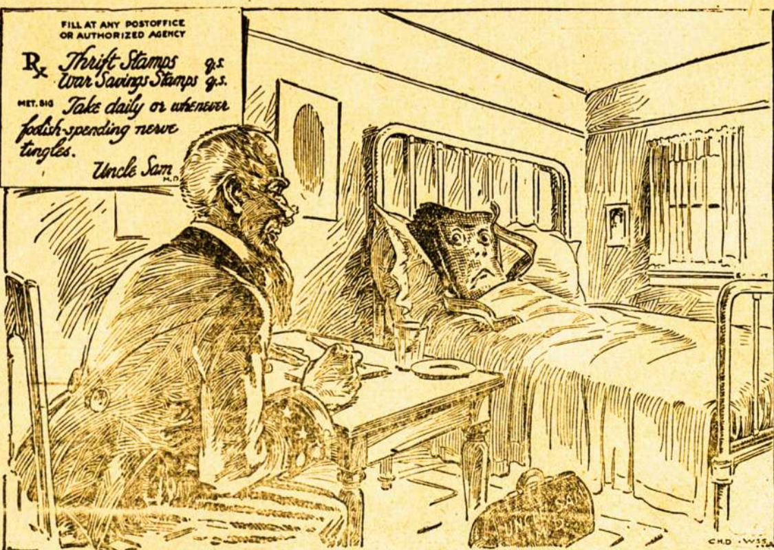
For a Sick Pocketbook

Juokų, Satyros, Savaitraštis, $2.00 metams. 951 Nathan Str. AKRON, OHIO.