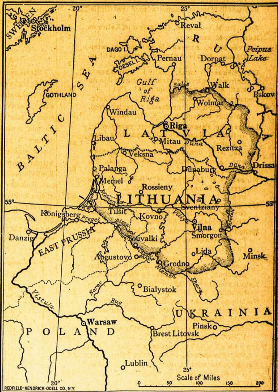
Zemlapis iš kun. A. Jusaičio knygos.

Butų geistina, kad patriotiški mūsų tautiečiai padė-tų praplatinti tą knygą ypač Amerikoje tarp Valstijų valdininkų (state officials) ir miestų kazygnų.