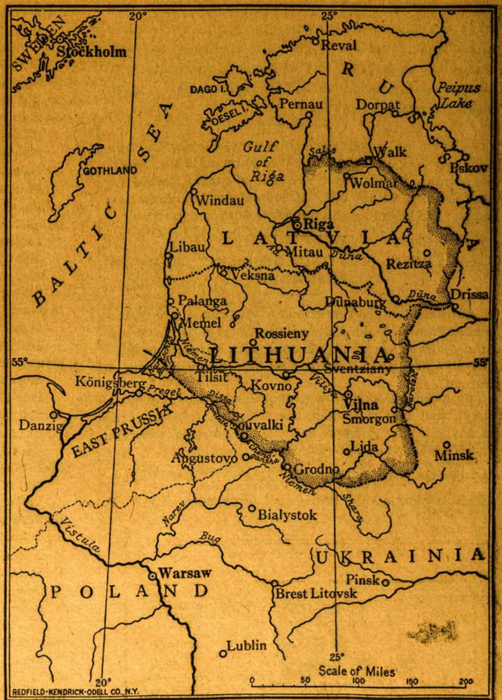
Zemlapis iš kun. A. Jusaičio knygos.

Antra laida turi apie 50 psl. daugiau nei pirmoji. Kaina antrosios laidos $1.50; skuro apdarais $3.50. Butų geistina, kad patriotiški musų tautiečiai padė-tų praplauti tą knygą ypač Amerikoje tarp Valstijų valdininkų (state officials) ir miestų knygynų.