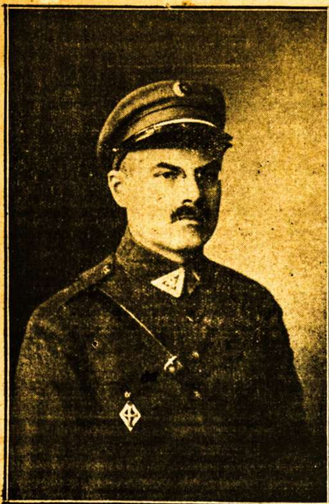
MAJORAS POVILAS ZADEIKIS

Advokatas Jonas Vileišis iš Majoras Povilas Zadeikis atkeliauja iš Paryžiaus Amerikon specialiai siunčiami Lietuvos valdžios bonų pardavinėjimo reikalais.