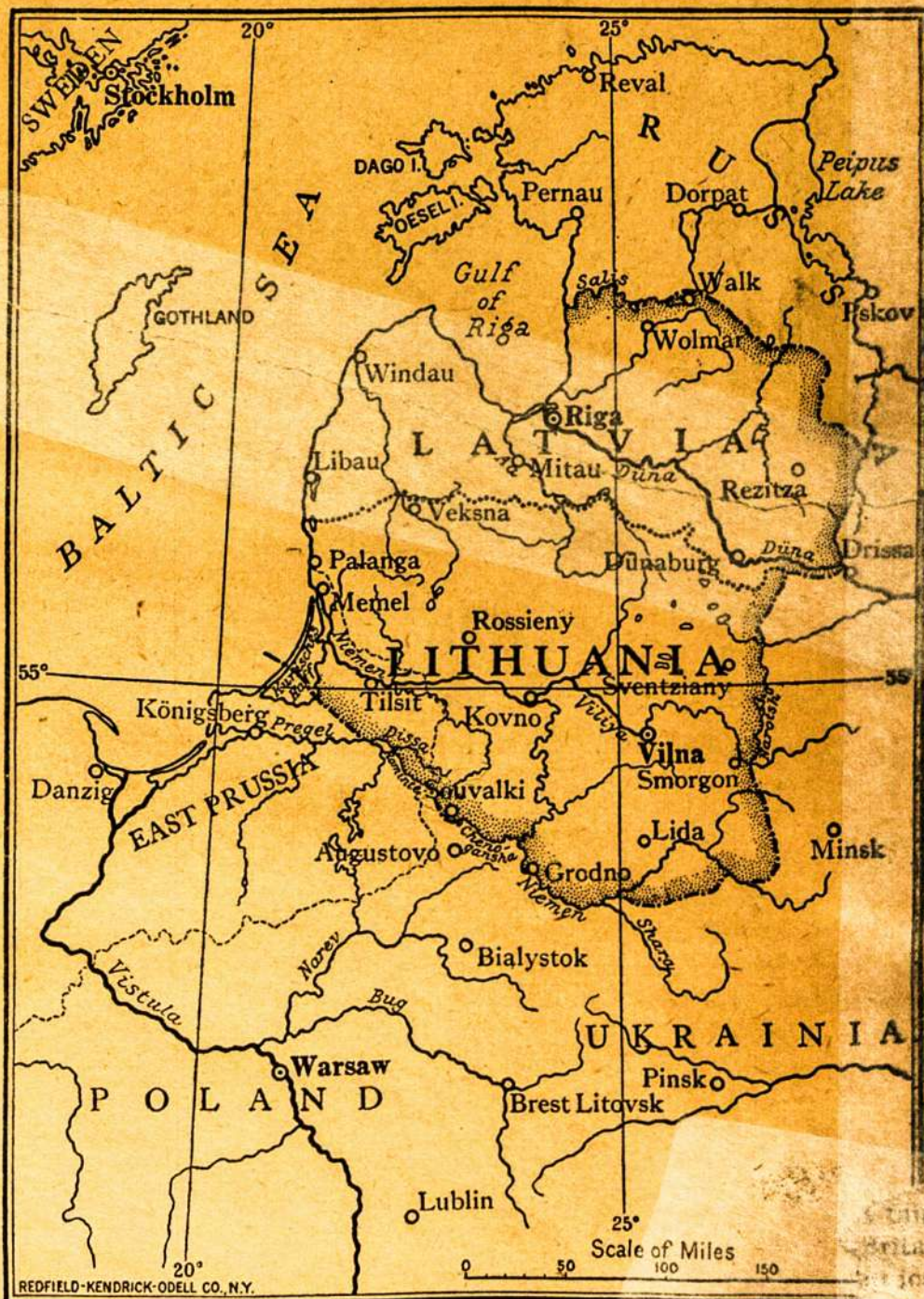
Zemlapis iš kun. A. Jusaičio knygos.

Butų geistina, kad patriotiški mūsų tautiečiai padėtų praplauti tą knygą ypač Amerikoje tarp Valstijų valdininkų (state officials) ir miestų knygynų.