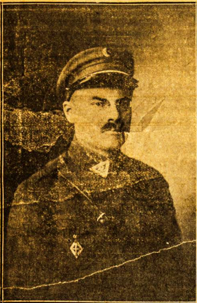
MAJORAS POVILAS ZADEIKIS