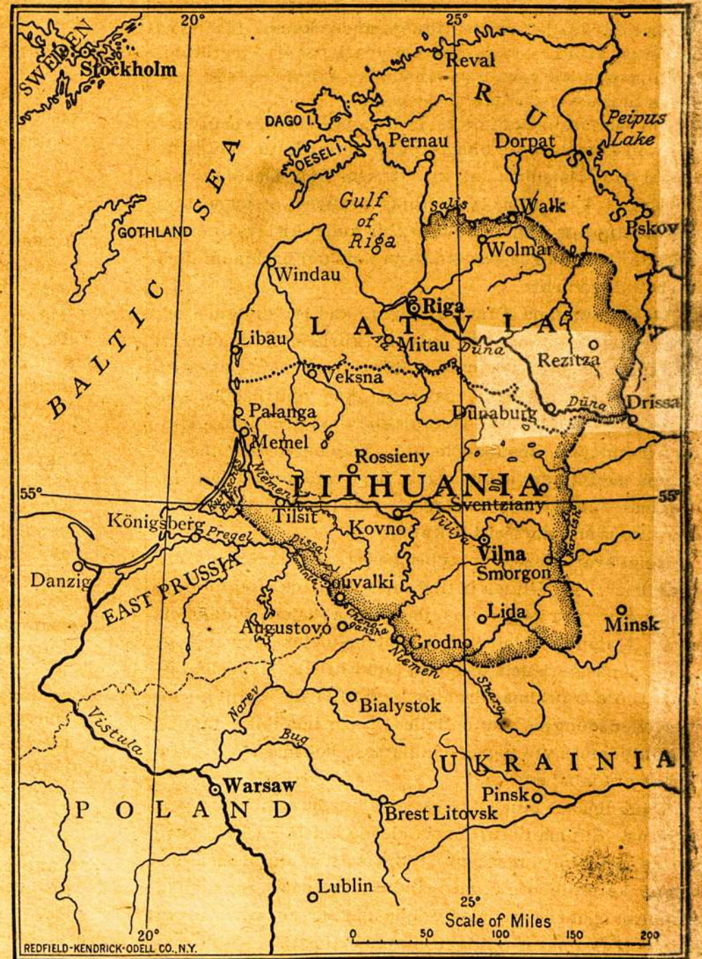
Zemlapis iš kun. A. Jusaičio knygos.

Butų geistina, kad patriotiški mūsų tautiečiai padė-tų praplatinti tą knygą ypač Amerikoje tarp Valstijų valdininkų (state officials) ir miestų knygynų.