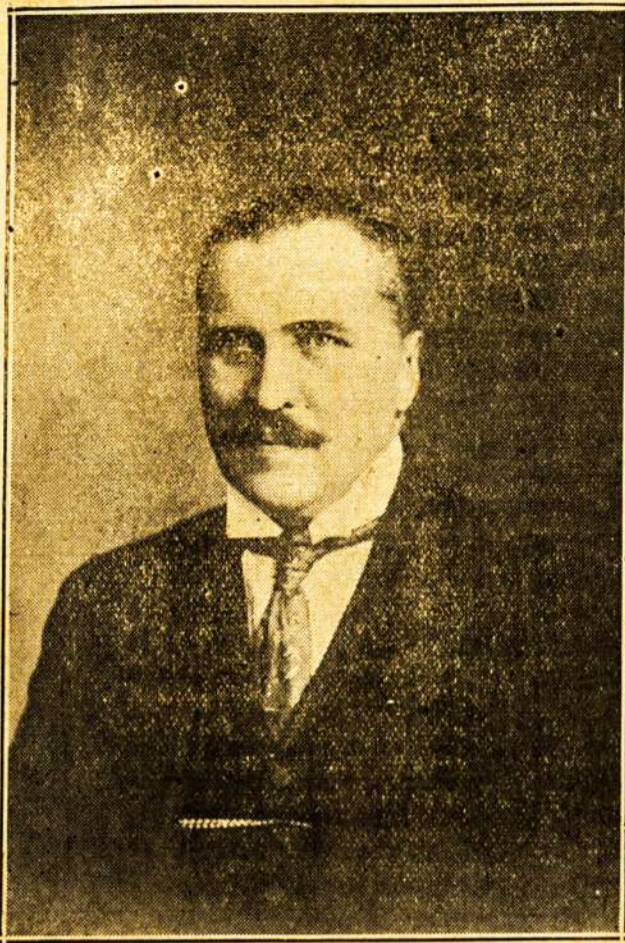
JONAS VILEISIS, BUVES LIETUVOS FINANSU MINISTERIS.

True translation filed with the Postmaster at Philadelphia, Pa., on February 19, 1920, as required by the Act of October 6, 1917.