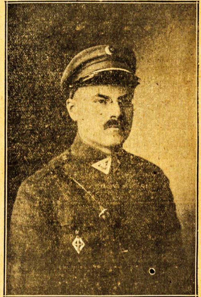
MAJORAS POVILAS ZADEIKIS BUVES LIETUVOS KARES MINISTERIS.