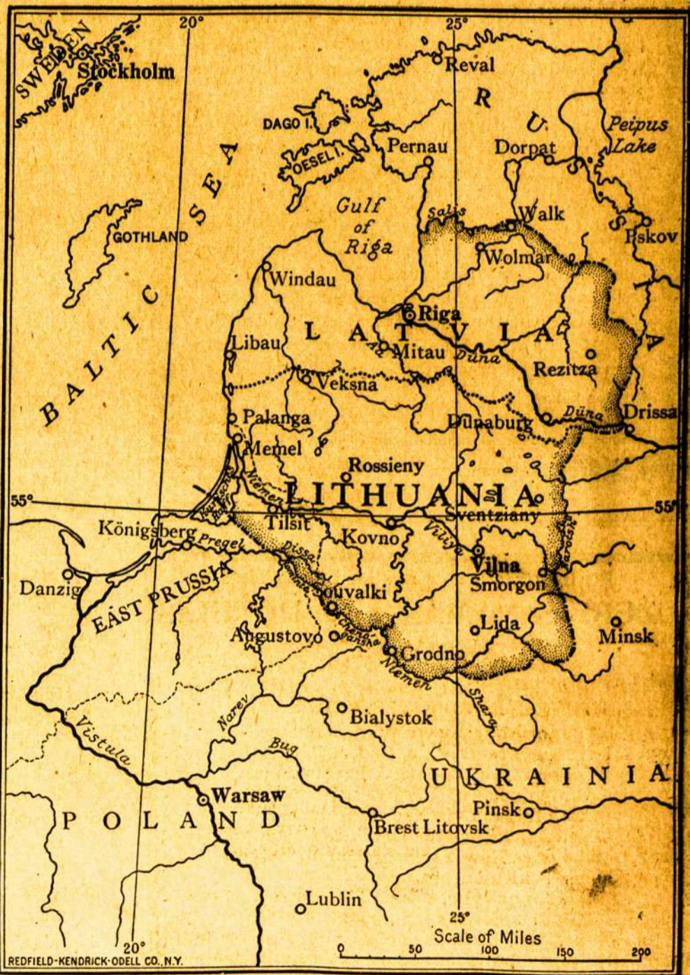
Zemlapis iš kun. A. Jusaičio knygos.

Butų geistina, kad patriotiski, mūsų tautiečiai padėtu praplatinti tą knygą įypač Amerikoje terp Valstijų valdininku (state officials) ir miestų knygynų.