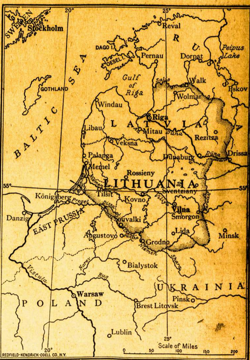
Zemlapis iš kun. A. Jusaičio knygos.

Butu geistina, kad patriotiškai musu tautėiiai padėtu praplatinti tą knygą įypač Amerikoje terp Valstiju valdininku (state officials) ir miestu knygynu.