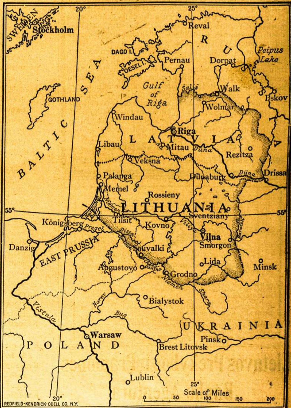
Zemlapis iš kun. A. Jusaičio knygos.

Butų geistina, kad patriotiški mūsų tautiečiai padėtų praplatinti tą knygą ypač Amerikoje terp Valstijų valdininkų (state officials) ir miestų knygynų.