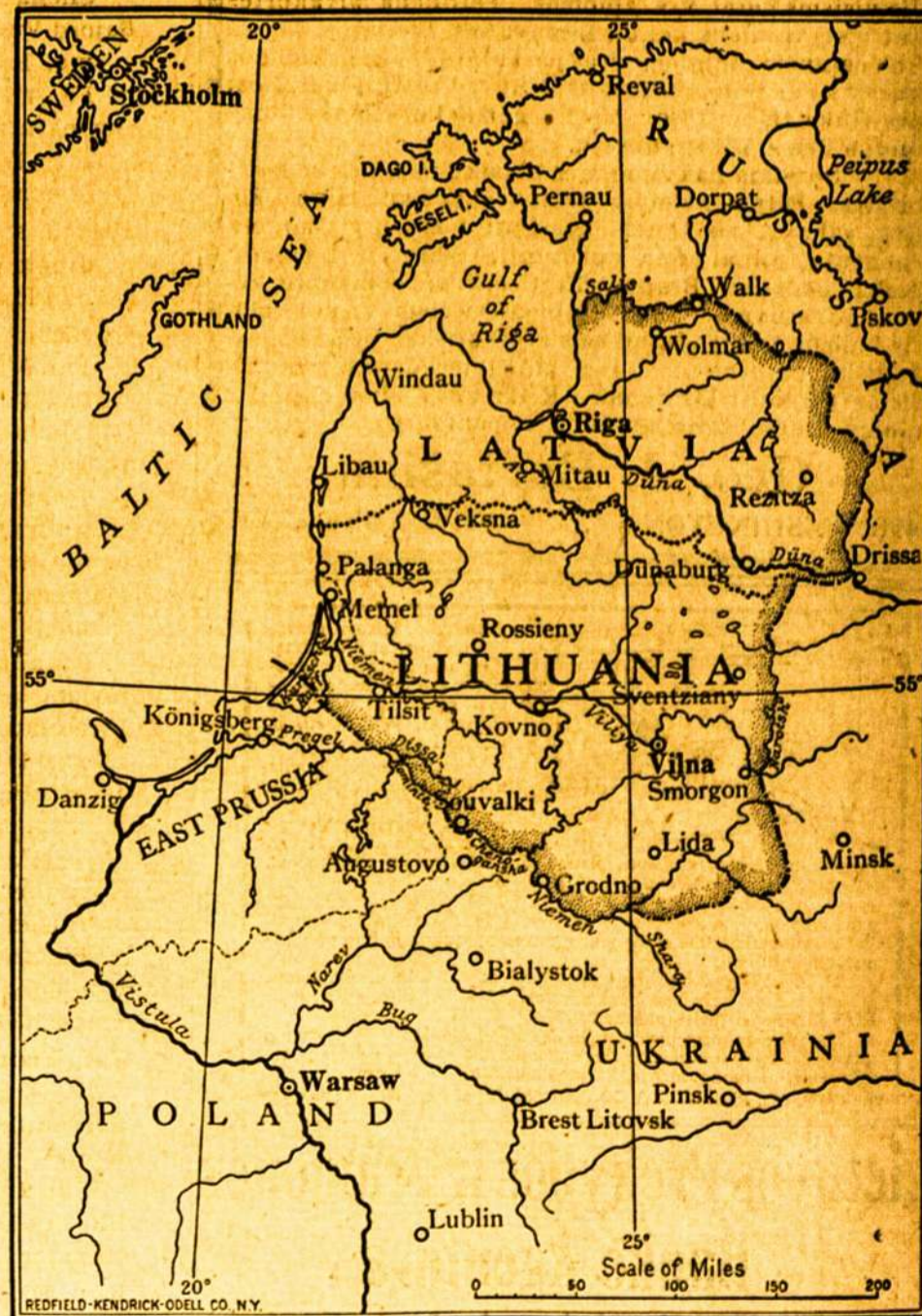
Zemlapis iš kun. A. Jusaičio knygos.

Butų geistina, kad patriotiški musų tautiečiai padėtų praplatinti tą knygą ypač Amerikoje tarp Valstijų valdininkų (state officials) ir miestų knygynų.