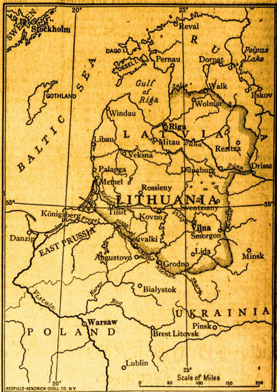
Zemlapis iš kun. A. Jusaičio knygos.

Butų geistina, kad patriotiški mūsų tautiečiai padėtų praplatinti tą knygą ypač Amerikoje tarp Valstijų valdininkų (state officials) ir miestų knygynų.