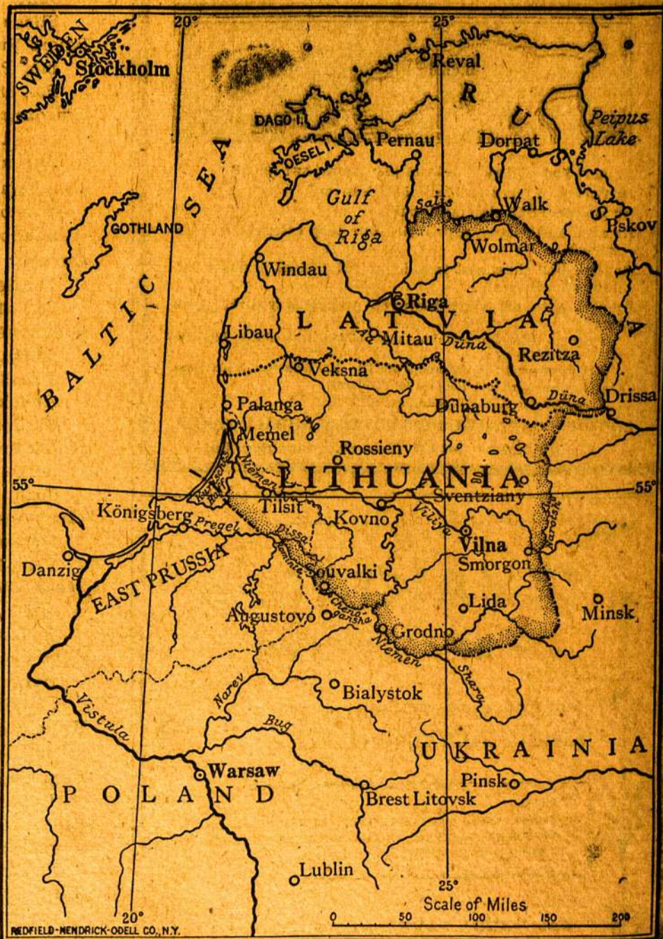
Zemlapis iš kun. A. Jusaičio knygos.

Antra laida turi apie 50 psl. daugiau nei pirmoji. Kaina antrosios laidos $1.50; skuro apdarais $3.50. Butų geistina, kad patriotiški musų tautiečiai padė-tų praplauti tą knygą ypač Amerikoje tarp Valstijų valdininkų (state officials) ir miestų knygynų.