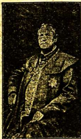
Vysk. M. Valančius pirmutinis ginamų raštų platintojų organizatorius.