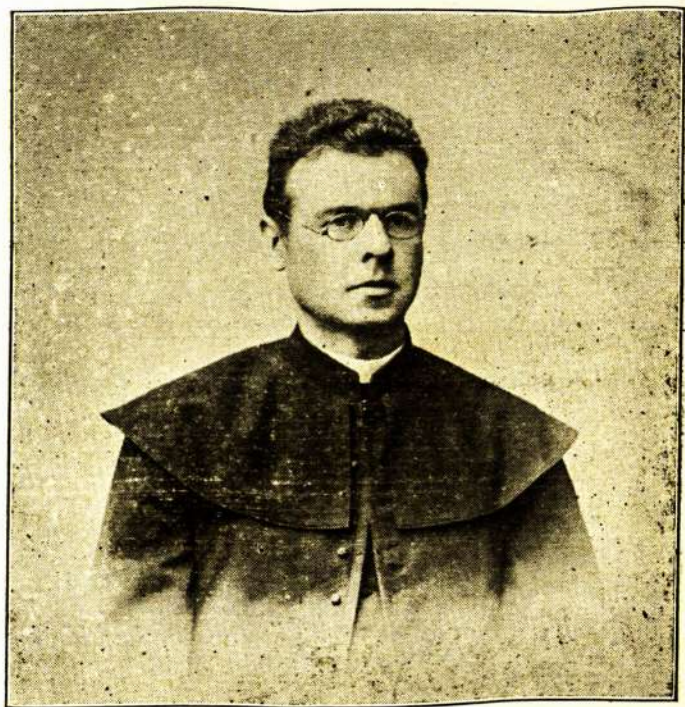
Prel. Maironis—Mačiulis didžiausias mūsų poetas, pasmerkė Lietuvos siurbėles išnaudotojus savo eilėse „Kai Kam“?