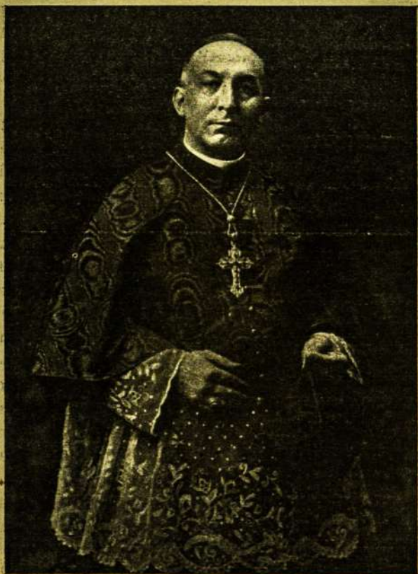
Jo Emin. Jurgis Kard. Mundelein, buvęs Brooklyno lietuvių klebonas, dabar Chicagos antvyskupas.