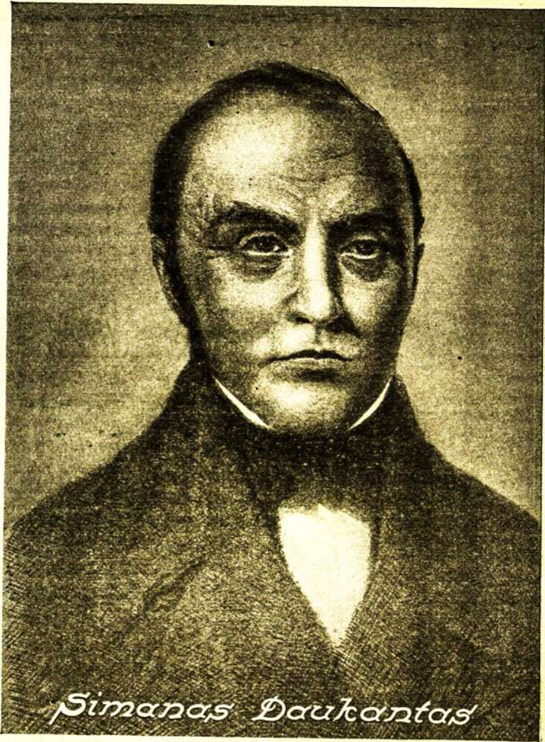
S. Daukantas, atbudusios Lietuvos idealas, Valančiaus sandarbininkas.