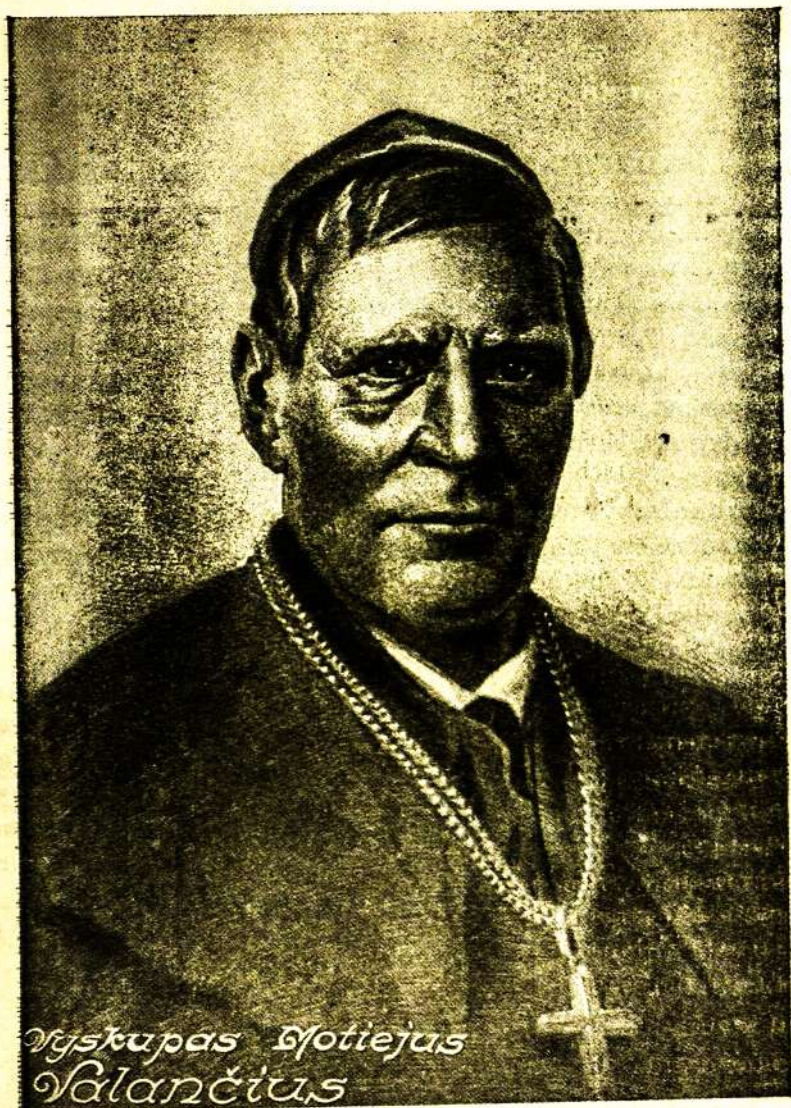
Biskupas Štotejus Salančius

„Draudžiamos“ literatūros įkūrėjas ir pasekmingiausias platintojas.